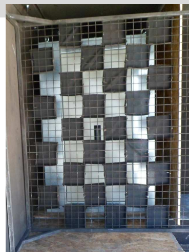
Essai de tenue à l'arc électrique