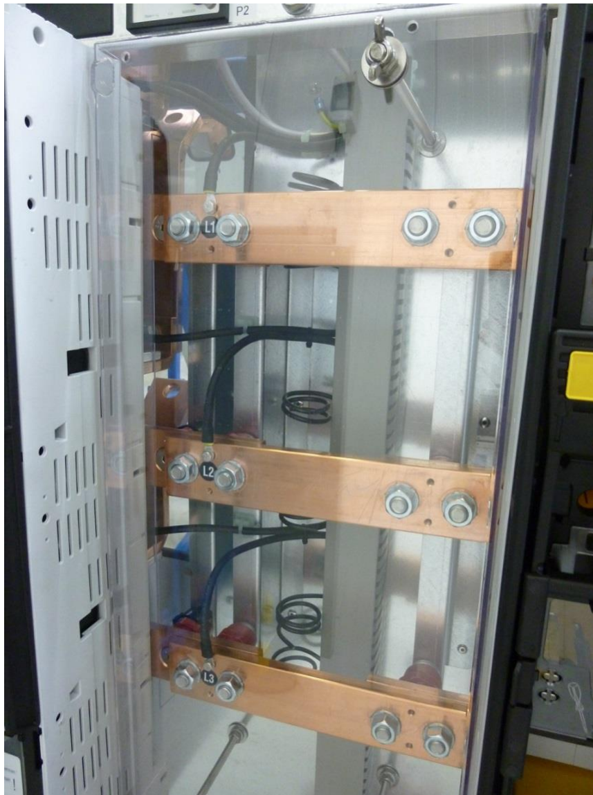
Abb.: Wandlerlaschen innerhalb des Stromschienensystems für spätere Wandlerrmontage

Der Einbau der Stromwandler erfolgt in der Regel auf Wandlerlaschen oder Anschlusschienen unter- oder oberhalb des Hauptschalters oder auf Wandlerlaschen innerhalb des Stromschienensystems.